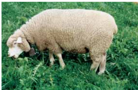
Mouton Blanc des Alpes

Les éleveurs suisses de moutons s'engagent pour que ces objectifs soient atteints d'une manière naturelle.