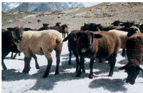
Mouton Brun-Noir du Pays