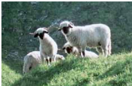
Mouton Nez Noir du Valais